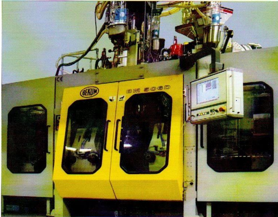
Die abgebildete Maschine enthält Extras zum Mehrpreis. Machine shown with optional equipment.